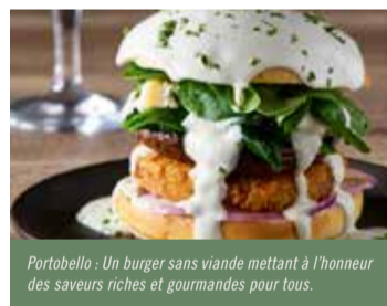
Portobello : Un burger sans viande mettant à l'honneur des saveurs riches et gourmandes pour tous.

Diversifier les sources de protéines est un enjeu pour l'environnement et pour notre équilibre alimentaire. En complément des viandes rouges, nos chefs utilisent davantage d'œufs, de viandes blanches, de poissons, et d'alternatives végétales.