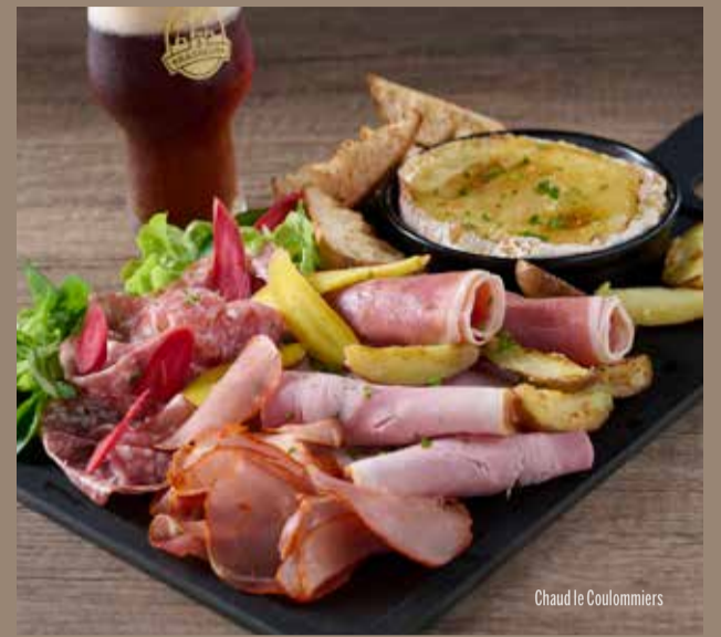
Chaud le Coulommiers