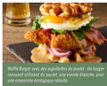
Waffle Burger avec des aiguillettes de poulet : Un burger innovant utilisant du poulet, une viande blanche, pour une empreinte écologique réduite.