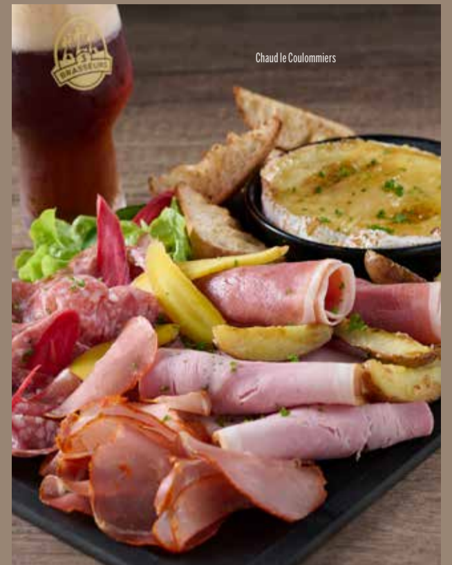
Chaud le Coulommiers