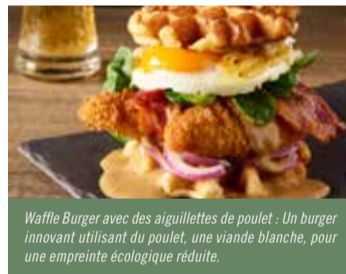
Waffle Burger avec des aiguillettes de poulet : Un burger innovant utilisant du poulet, une viande blanche, pour une empreinte écologique réduite.