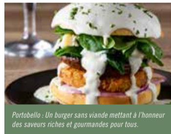
Portobello : Un burger sans viande mettant à l'honneur des saveurs riches et gourmandes pour tous.

Diversifier les sources de protéines est un enjeu pour l'environnement et pour notre équilibre alimentaire. En complément des viandes rouges, nos chefs utilisent davantage d'œufs, de viandes blanches, de poissons, et d'alternatives végétales.