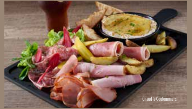
Chaud le Coulommiers