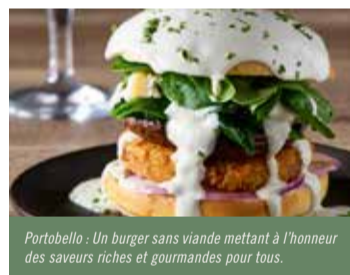
Portobello : Un burger sans viande mettant à l'honneur des saveurs riches et gourmandes pour tous.

Diversifier les sources de protéines est un enjeu pour l'environnement et pour notre équilibre alimentaire. En complément des viandes rouges, nos chefs utilisent davantage d'œufs, de viandes blanches, de poissons, et d'alternatives végétales.