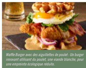
Waffle Burger avec des aiguillettes de poulet : Un burger innovant utilisant du poulet, une viande blanche, pour une empreinte écologique réduite.