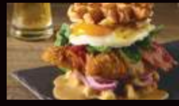
Waffle Burger avec des aiguillettes de poulet : Un burger innovant utilisant du poulet, une viande blanche, pour une empreinte écologique réduite.