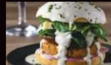
Portobello : Un burger sans viande mettant à l'honneur des saveurs riches et gourmandes pour tous.

Diversifier les sources de protéines est un enjeu pour l'environnement et pour notre équilibre alimentaire. En complément des viandes rouges, nos chefs utilisent davantage d'œufs, de viandes blanches, de poissons, et d'alternatives végétales.