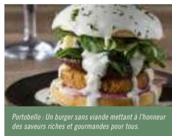
Portobello : Un burger sans viande mettant à l'honneur des saveurs riches et gourmandes pour tous.

Diversifier les sources de protéines est un enjeu pour l'environnement et pour notre équilibre alimentaire. En complément des viandes rouges, nos chefs utilisent davantage d'œufs, de viandes blanches, de poissons, et d'alternatives végétales.