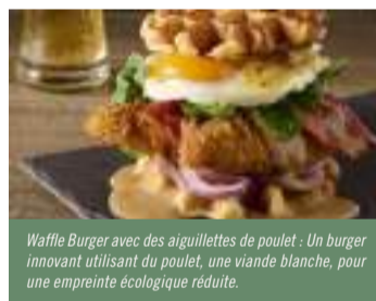
Waffle Burger avec des aiguillettes de poulet : Un burger innovant utilisant du poulet, une viande blanche, pour une empreinte écologique réduite.